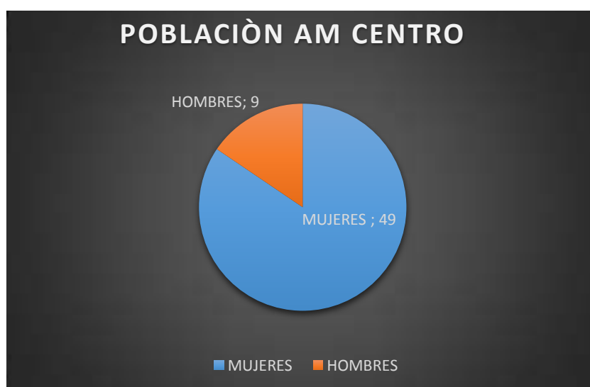
GRAFICO 1; GÈNERO DEL GRUPO DE AM CENTRO

En el grupo de adulto mayor ya mencionado, funciona en instalaciones del Gobierno parroquial en dos jornadas; es así que se los señala como CENTRO Y CUENDINA, que son los dos barrios en los que funciona.