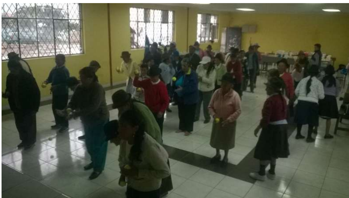
Anexo N°2. Grupo de adulto mayor “Sonrisas Doradas”.