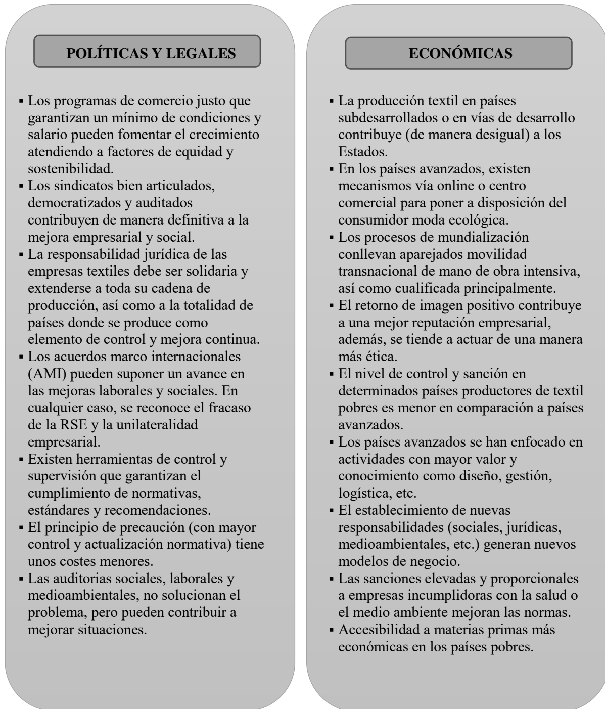
Figura 2. Factores políticos, legales y económicos que inciden y promocionan los procesos de producción textil